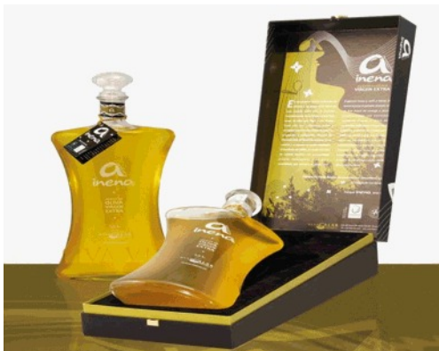
Geschenkkassette mit span. Olivenöl "extra vergine" der Firma INENA

5J Schinken hat ein anhaltendes Aroma und einen unvergleichlichen Geschmack und Ausklang. Aufgeschnitten hat er eine einheitliche Farbe mit unzähligen glänzenden Streifen von angesammeltem Fett. Er ist weltweit der meistgeschätzte Schinken.